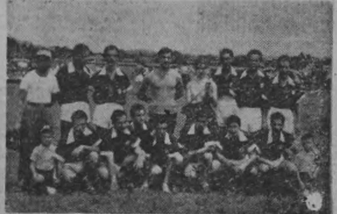
Aquí presentamos a los muchachos del Banco Central que mañana defienden su invicto.

han terminado sus entrenamientos mañana en que colocarán de esta semana y están listos para sus mejores hombres.